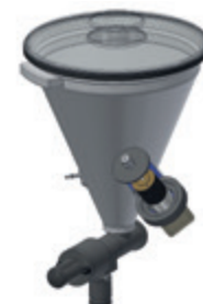
Abb.: Dosiereinheit für GRANUDOS-FLEX